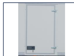
Porte latérale battante

*Dimensions à titre informatif, non contractuelles, pouvant évoluer selon la configuration du véhicule. Tolérances \pm 3\%