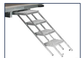
Escabeau 4 marches coulissant