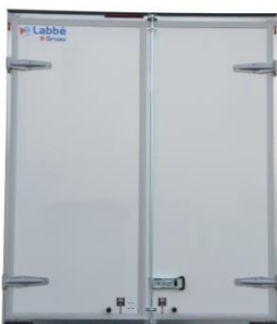
Fermeture par 2 portes arrière battantes version simple