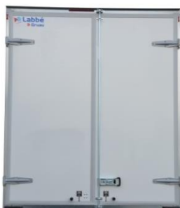
Fermeture par 2 portes arrière battantes version simple