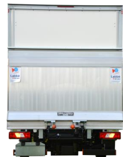
Fermeture par un auvent relevable arrière et hayon élévateur