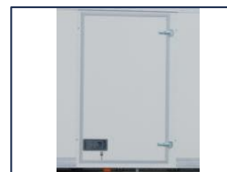
Porte latérale battante

*Dimensions à titre informatif, non contractuelles, pouvant évoluer selon la configuration du véhicule. Tolérances ±3%