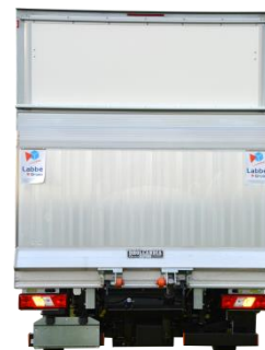
Fermeture par un auvent relevable arrière et hayon élévateur