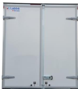
Fermeture par 2 portes arrière battantes version simple