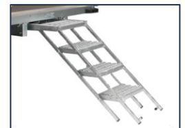
Escabeau 4 marches coulissant