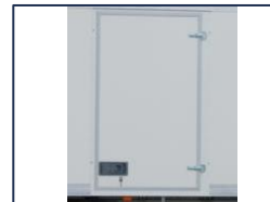
Porte latérale battante

*Dimensions à titre informatif, non contractuelles, pouvant évoluer selon la configuration du véhicule. Tolérances ±3%