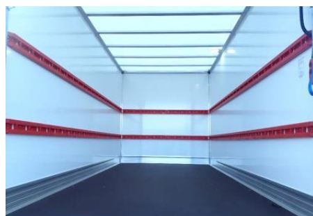
Aménagement Mixte 2 niveaux de capitons composite allégés 2 en 1