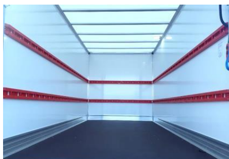
Aménagement Mixte 2 niveaux de capitons composite allégés 2 en 1