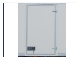
Porte latérale battante

*Dimensions à titre informatif, non contractuelles, pouvant évoluer selon la configuration du véhicule. Tolérances ±3%