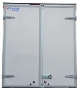
Fermeture par 2 portes arrière battantes version simple